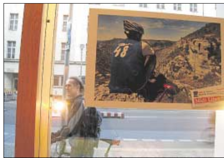
C'est fait : pour un mois, la Lozère (et son quotidien !) sont à l'affiche.