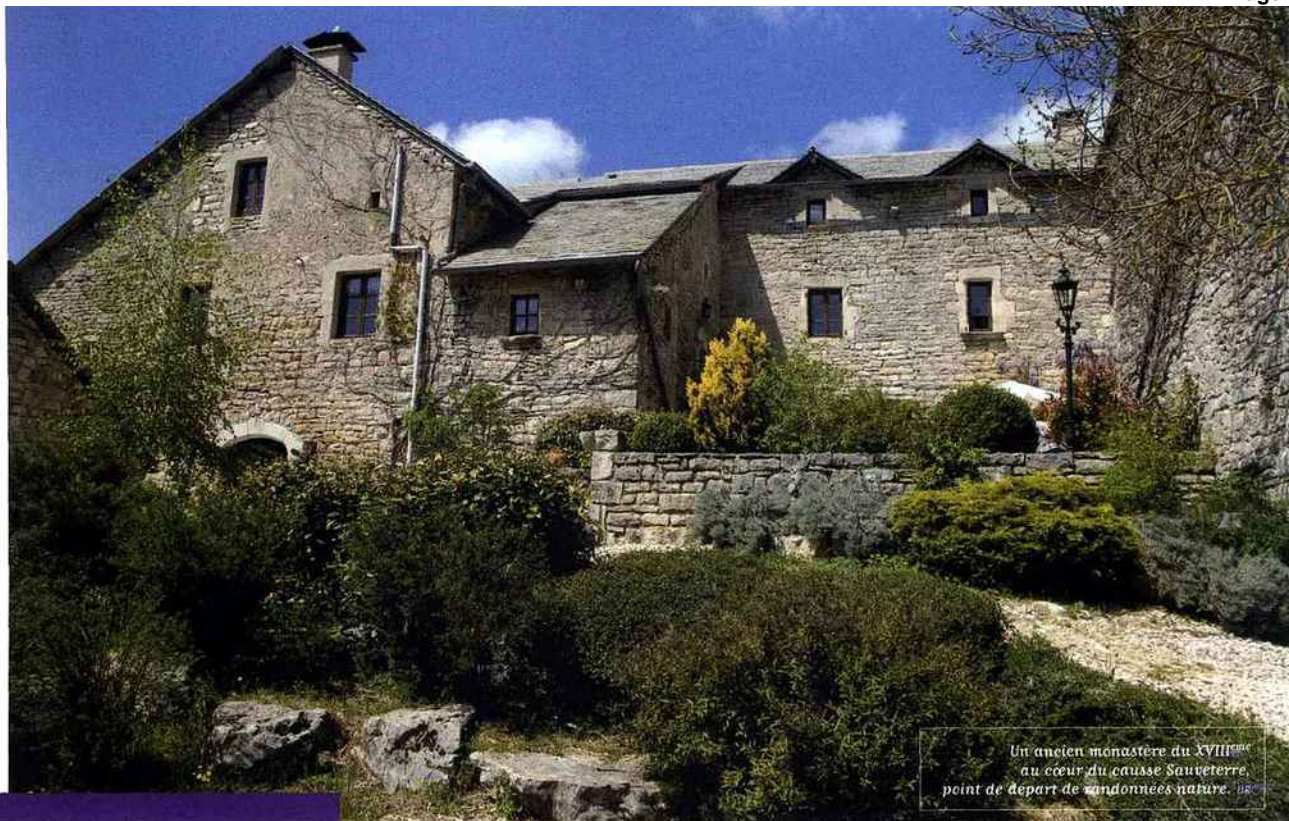
Un ancien monastère du XVIII ème au cœur du causse Sauveterre, point de départ de randonnées nature.